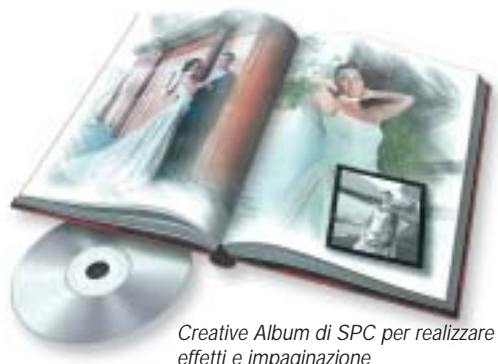
Creative Album di SPC per realizzare effetti e impaginazione

gata prevede i file elaborati dal fotografo. Per ogni libro possono essere realizzati due o più minibook.