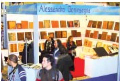
Quattro linee grafiche per il Love Book Forever di Boninsegna

Un modello di formato eccezionale, 70x100, è stato esposto da Sara Album , che comunque propone anche formati di dimensioni più tradizionali. La lavorazione viene seguita in tutti i suoi passaggi, dalla scansione delle foto alla stampa, la realizzazione del blocco, la rilegatura, fino alla realizzazione in falegnameria della valigia che conterrà l'album. E anche la elaborazione e impaginazione delle immagini viene curata, al di fuori di ogni standard, scegliendo la soluzione migliore per ciascuna foto. Inoltre si può far realizzare il pieghevole a 5 ante con i ritratti degli sposi e la firma del fotografo da distribuire sui tavoli del ristorante.