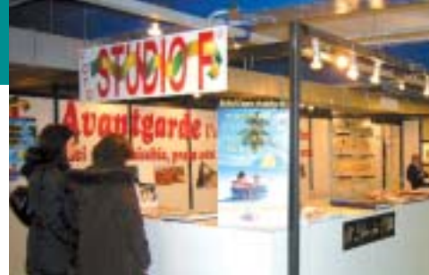
Grafica digitale e a mano libera per Avantgarde , il fotolibro di Foto Studio F