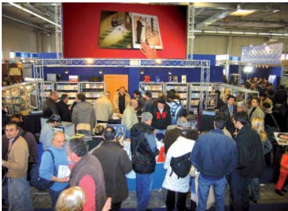
Il Photo & Digital Expo a Roma è stato un punto di attrazione per i fotografi di matrimonio

Q ualcuno lo dubitava? Il Photo & Digital Expo ha visto la presenza di un numero elevatissimo di fotografi specializzati in matrimonio, che hanno rappresentato una percentuale elevata di quei 42 mila visitatori registrati. Ancora una volta Roma è stata in grado di attrarre fotografi da tutto il centro-sud che ormai considerano l'appuntamento nella capitale come un momento importante per vedere e confrontare tutto quanto offre il mercato per il loro lavoro. Da tempo hanno avvicinato il digitale: dapprima per elaborare le immagini e ora anche per riprenderle. Le attrezzature ormai sono conosciute e i fotografi sanno che periodicamente usciranno dei nuovi apparecchi fotografici in grado di permettere una maggiore qualità, determinata dalla risoluzione, la velocità di scatto, la versatilità. Se per quanto riguarda le attrezzature da ripresa al Photo & Digital Expo sapevano di non poter trovare tutta la scelta desiderata, causa l'assenza di molte delle aziende associate all'Aif, a Roma hanno però cercato quelle aziende che potevano rispondere alle loro necessità per quanto riguarda la realizzazione di foto particolari, ormai sempre più richieste in que-