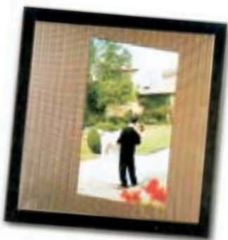
Acciaio inossidabile per le copertine di Stilalbum

Non basta realizzare un bel servizio matrimoniale: è necessario che anche la presentazione sia alla stessa altezza. A questo punto il fotografo si trova davanti due alternative: la scelta verrà fatta dagli sposi, ma tocca al fotografo prospettare le due possibilità. La prima, che sarebbe sbagliato definire tradizionale con valore negativo, prevede le immagini impaginate in un album. È una presentazione di tipo classico, destinata a essere apprezzata anche da genitori e parenti e per molti anni ancora. Il Photo & Digital Expo ha mostrato molti modelli di album, in grado di accontentare i gusti più differenti. In molti casi al centro della copertina è possibile inserire la foto degli sposi, per il massimo della personalizzazione.