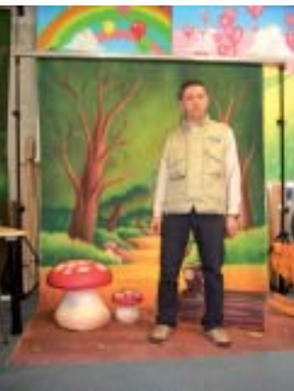
Tanti elementi d'arredo per D'Aponte

Oppure l'idea originale può consistere nel trasformare un angolo del ristorante in un set fotografico. D'Aponte ha degli elementi d'arredo come il cancelletto, i gradini di pietra colorata, il pozzo, la sedia originale che consentono delle foto insolite. Mentre per ambientare le foto dei bambini - che possono anche essere i paggetti al matrimonio - ha dei fondali con disegni studiati per loro. ■