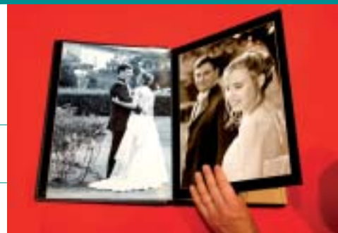
Book Star da Edicart per montare le foto con effetto fotolibro