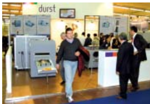
Durst ha la Photo Book Station per realizzare fotolibri

A chi preferisce il «fai da te» completo