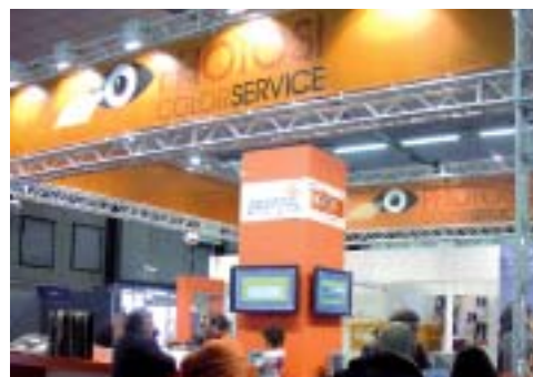
Software Epoca per realizzare l'album digitale con Photosi