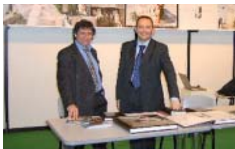
Due linee di libri digitali per Photo Play

Altri sposi sceglieranno invece la soluzione dell'album tipo libro. È una proposta che tutte le case specializzate in album ormai fanno. Ma, oltre a loro, da tempo, anche altre aziende e i laboratori fanno proposte simili. Ad aprire la strada in Italia è stato Graphistudio , che propone album libro di formati che vanno dal 40x50 al 35x45 fino al 20x30, verticali, orizzontali o quadrati e consente di scegliere tra cinque grafiche differenti, lasciando comunque al fotografo la possibilità di curare personalmente l'impaginazione e chiedere solo la realizzazione finale.