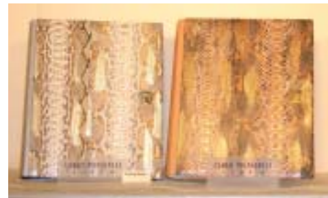
Copertine in pitone naturale per gli album Carlo Pignatelli

supervisiona l'album finale da lui firmato. Una scelta di materiali particolari caratterizza anche Stilalbum , che per le sue copertine ha scelto di usare l'alluminio, l'acciaio inossidabile, il legno wengee, la carta tipo alluminio, la ceramica opaca grezza, oltre al cuoio morbido antichizzato.