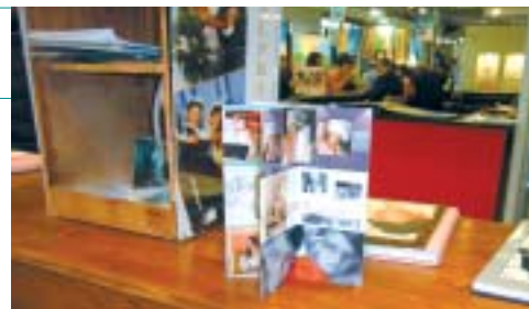
Un pieghevole con i ritratti degli sposi, oltre al fotolibro, da Sara Album

Le doppie pagine a ribalta hanno attirato l'attenzione dei fotografi presso lo stand di Digital Printing New Play Color . Qui il fotolibro si presentava con le nuove copertine in acciaio, nei formato orizzontale e verticale, con possibilità di contenere il numero di pagine che si desidera senza limita-