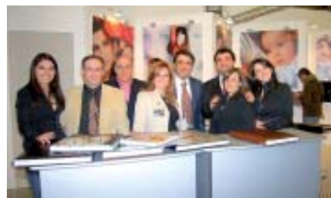
Doppie pagine a ribalta per il fotolibro di Digital Printing New Play Color

zioni, grazie alla lavorazione di tipo artigianale e non meccanizzata.