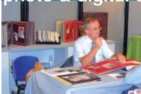
Album con passepartout a smusso da Scappi Cartoni

Tra oltre duecento copertine differenti è la scelta proposta da Sara Album il marchio di Gianca Album, che offre al fotografo la possibilità di corredare l'album con la valigia e con la foto stampata e incorniciata da appendere.