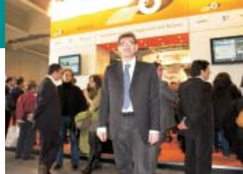
Fotolibro anche dai laboratori Fincolor Group