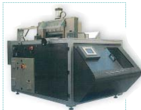
Con la macchina di Novomodo è possibile eseguire tutte le fasi di realizzazione dell'album fotolibro, compreso la rilegatura

la professione il fotografo può decidere di mostrare subito agli sposi e agli invitati le immagini riprese in digitale. Per questo può utilizzare una valigia Cantoni, che gli consente di avere un piano d'appoggio su cui mettere il computer portatile, in qualsiasi luogo si trovi. Può così far scegliere le foto che ritraggono gli sposi insieme agli amici.