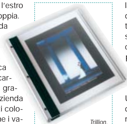
Trillion, nella linea Nietzsche di Acerboni, con copertina in plexiglas per una proposta hi-tech

Ma anche il momento della ripresa può essere ad alto valore tecnologico per soddisfare questo tipo di sposi. Al di là della scelta dell'attrezzatura per lo svolgimento del-