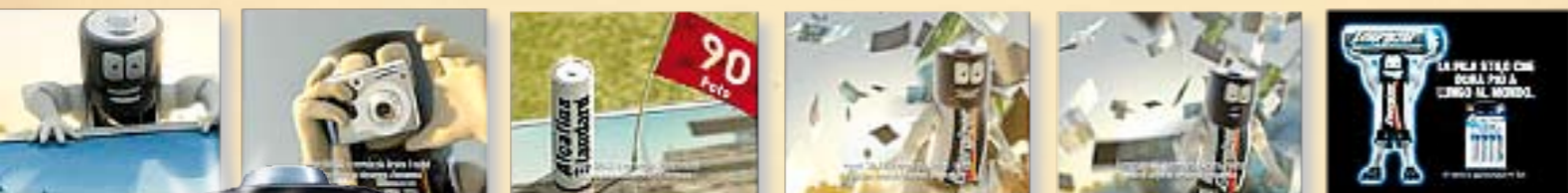
In alto, alcuni frame dello spot tv dedicato ai nuovi prodotti Energizer Ultimate Lithium