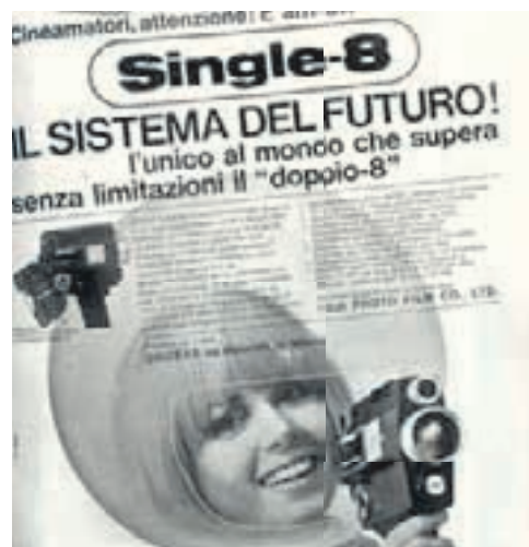
La Fuji presenta il Single 8 in concorrenza al Super 8 di Kodak

Negli anni '70' e '80 la diffusione del colore a costi sempre più contenuti, anche grazie al successo del sistema Kodak Instamatic, rende popolare la fotografia e fa crescere i numeri del settore. Contemporaneamente i progressi dell'industria chimica e delle nuove tecnologie rendono lo sviluppo e la stampa del negativo a colori un processo industriale. Crescono i laboratori photofinishing che offrono una produzione standardizzata di ottima qualità. Il fotografo con negozio diventa sempre più commerciante di attrezzature e consulente per i servizi di sviluppo e stampa. Differenziandosi dal fotografo che lavora con attrezzature professionali e produce fotografie di qualità per l'editoria, l'industria e di ce-