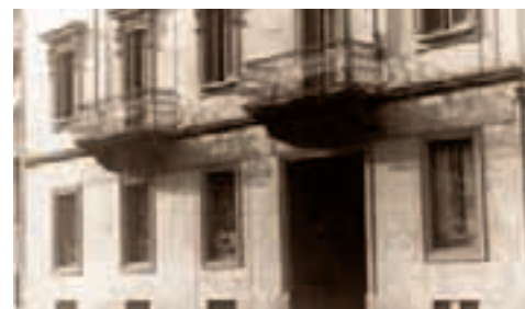
Il vecchio portone di via Melloni 17 a Milano, sede attuale del Foto-Notiziario, com'era subito dopo la guerra. Via Po 11 a Torino, oggi. Dietro questo portone è nato il Foto-Notiziario nell'ottobre 1946.