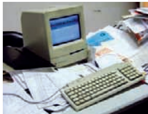
È Macintosh la parola magica che affascina tutte le redazioni. Il suo successo sarà travolgente e in pochi anni sconvolgerà il modus operandi dell'editoria