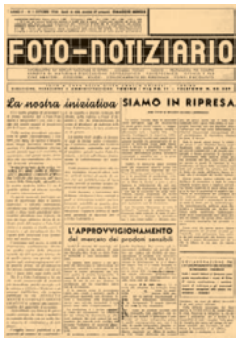
La copertina, ormai storica, del primo numero di Foto-Notiziario uscito nell'ottobre 1946. Il primo bollettino della ditta Bernardoni pubblicato nell'inverno del 1946. Diventerà la rivista Rassegna Grafica