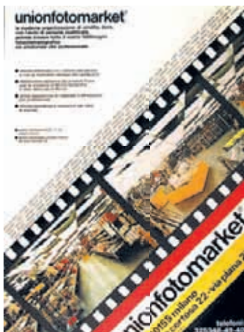
Il messaggio della Unionfotomarket. I moderni grossisti sono ora organizzati come cash&carry

Anni 80/90: Il costo dell'argento e dei sistemi anti-inquinamento manda in crisi il mercato del sensibile. Per il cinema casalingo è la fine e solo dopo qualche anno verrà sostituito dalle videocamere con l'affermarsi dello standard Vhs della Jvc e poi Video8 della Sony. Ai fotografi toccheranno solo le briciole delle vendite, ma porterà il nuovo ricco business del video di cerimonia. Invece la fotografia riesce a difendersi diminuendo le dimensioni della pellicola e migliorando la chimica. Il 110 Instamatic di Kodak ha un