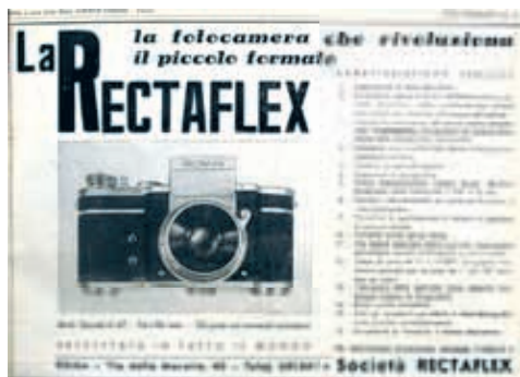
La presentazione della Rectaflex nel maggio '48. La pubblicità sul primo numero di Foto-Notiziario

Anni 50: pellicola e carta sensibile richiama tanta attenzione anche perché sono difficili da reperire. Gli annali ci dicono che in questo periodo nascono il Kodacolor, poi il Fujicolor e la Polaroid. Ma in Italia, in attesa delle importazioni d'oltremare e della rinascita di Agfa, si usa il bianco-nero Ferrania e la