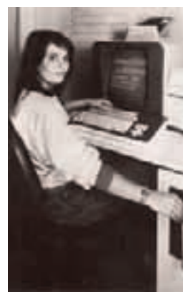
L'arrivo della fotocomposizione ha segnato una svolta soprattutto per la flessibilità nella gestione del testo (che comunque andava ribattuto) e per la qualità. Ben tre generazioni di Varityper, dai dischi ottici, al crt, al laser, hanno composto i testi del Foto-Notiziario.