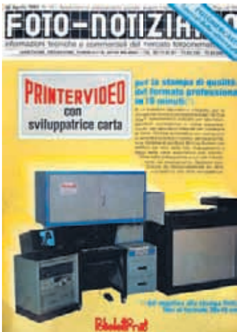
La Printervideo della Polielettronica il laboratorio integrato per la produzione di ingrandimenti e stampe professionali

nuova attività dai mille risvolti tutti da scoprire. Contemporaneamente esce il nuovo formato Aps che vuole rilanciare la fotografia tradizionale davanti all'emergente rivoluzione digitale. La concorrenza spinge le Case a produrre una quantità impressionante di nuovi modelli e il fotografo ha bisogno soprattutto di una puntuale informazione su novità ed evoluzione del mercato. Foto-Notiziario non può rimanere insensibile a questa situazione e, a quasi 50 anni dalla nascita, fa confluire i vari frammenti edi-