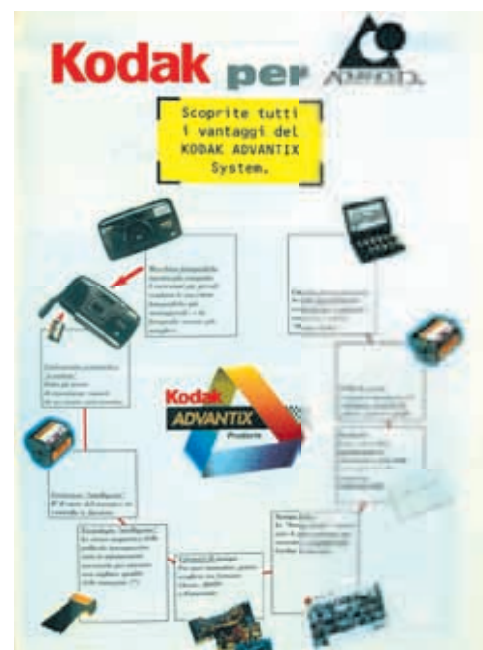
La Kodak presenta il sistema Aps. È l'ultimo tentativo di difesa della pellicola dal digitale

le attrezzature tecnologiche ricevono un impulso straordinario e i cambiamenti spingono gli operatori del settore della fotografia a rilanciarsi in un mix di nuove attività. I minilab rivoluzionano l'attività del fotonegoziante e diffondendosi capillarmente costringono i laboratori a riunirsi in grandi gruppi. La riduzione del gap qualitativo tra attrezzature professionali e amatoriale non delimita più con certezza i due settori, se non nelle applicazioni più esasperate. Il video acquista ottima qualità con il digitale e continua ad essere una realtà economica per il fotografo di cerimonia. L'elaborazione digitale delle immagini è una