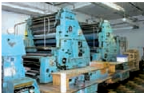
La macchina da stampa offset Roland a 4 colori, formato 70x100, che per dieci anni ha stampato il Foto-Notiziario, il Fotolaboratorio, il Professionale, il Photo made in Italy e il Chi è, in tutte le loro diverse edizioni