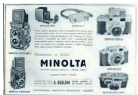
Le prime pubblicità di Canon e di Minolta che annunciano l'inizio dell'importazione in Italia