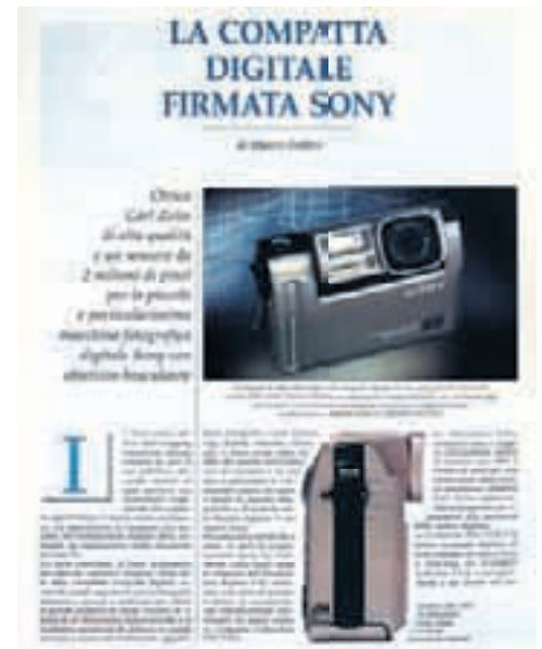
Kodak e Sony: sono le prime digitali amatoriali arrivate in redazione per una prova. Siamo nel 1999 e hanno sensori da 1 a 2 megapixel. Quanti modelli seguiranno e a quale evoluzione dovremo assistere in tempi brevissimi!