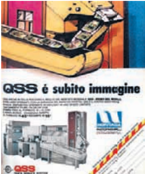
La presentazione del QSS della Noritsu: è il minilab per la stampa amatoriale