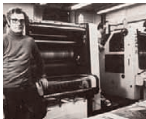
Sotto: Le due offset Aurelia con le quali è stampato il Foto-Notiziario dal 1974 al 1983