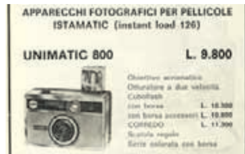
Un modello di fotocamera Instamatic della Bencini, con il caricatore 126 della Kodak

Negli anni '70' e '80 la diffusione del colore a costi sempre più contenuti, anche grazie al successo del sistema Kodak Instamatic, rende popolare la fotografia e fa crescere i numeri del settore. Contemporaneamente i progressi dell'industria chimica e delle nuove tecnologie rendono lo sviluppo e la stampa del negativo a colori un processo industriale. Crescono i laboratori photofinishing che offrono una produzione standardizzata di ottima qualità. Il fotografo con negozio diventa sempre più commerciante di attrezzature e consulente per i servizi di sviluppo e stampa. Differenziandosi dal fotografo che lavora con attrezzature professionali e produce fotografie di qualità per l'editoria, l'industria e di ce-