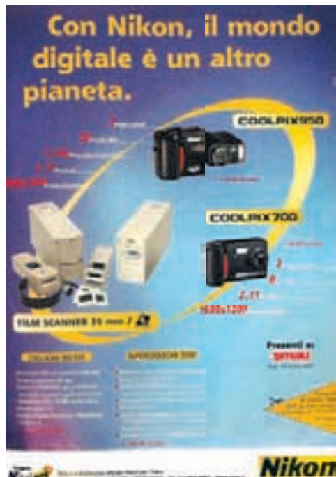
Una delle prime inserzioni della Nikon per il digitale. Oltre che con Kodak e Sony sarà sul mercato con Benq, Casio, Canon, Epson, Fujifilm, Hp, Olympus, Panasonic, Pentax, Praktica, Ricoh, Rollei, Samsung, Sanyo, Vivitar, Yashica e tante altre