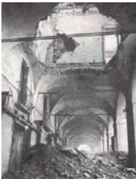
I portici di via Po a Torino dopo il bombardamento del dicembre 1942.