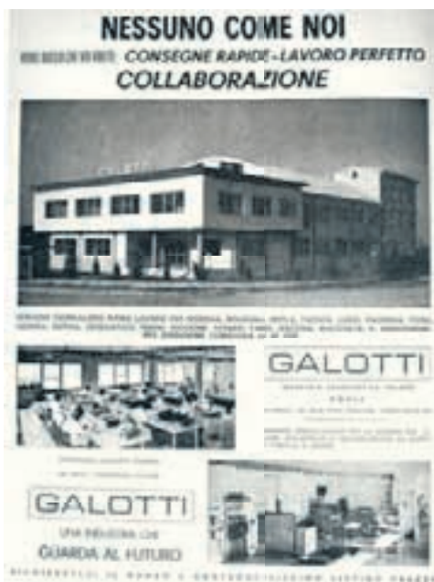
I laboratori photofinishing offrono ai fotografi una produzione di qualità e un veloce servizio di consegna

rimonia. In pratica i lettori del Foto-Notiziario si diversificano sempre più in categorie con interessi specifici differenti. E le edizioni della rivista si adeguano alle esigenze del mercato. Nel 1975 nasce il Foto-Laboratorio, nel 1978 il Repertorio, l'attuale Chi è, e nel 1980 il Giornale, per informare delle continue novità in arrivo. Nel 1981 nasce il Photo Made in Italy, redatto in inglese per presentare la produzione italiana a tutti gli importatori del mondo. Infine nel 1982 per chi opera in sala di posa nasce il Foto-Notiziario Professionale che evolverà poi nell'edizione Professional Imaging nel '93.