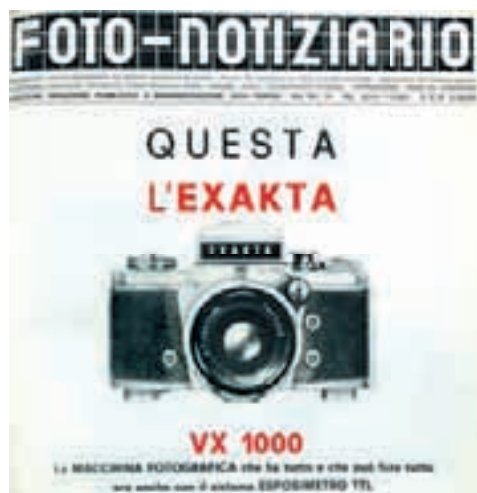
La pubblicità dell'Exakta. La prestigiosa reflex tedesca è presente sul Foto-Notiziario fin dai primi anni di pubblicazione

Anni 60/70: Sono gli anni del Super 8 che scatena in tutte le case, con la tv ancora in bianconero, la passione del filmato a colori. Ma anche della diapositiva che consente a costi contenuti la produzione di immagini di grande qualità. Il Kodachrome e poi l'Ektachrome e il Fujichrome permettono di sfruttare tutta la qualità delle fotocamere e delle ottiche che hanno raggiunto una grande perfezione. Alla necessità di prede-terminare l'inquadratura, l'industria risponde con l'offerta di una vasta gamma di ottiche di tutte le focali, fino all'arrivo degli zoom che rivoluzionano il modo di fare fotografia. Le fotocamere tedesche sono prestigiose ma molto costose e l'industria giappone-